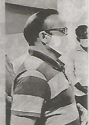
की व्यवस्था की गई थी। इससे अलावा, सरकार के आदेश के अनुसार, टीकाकरण केंद्रों पर व शिफ्टों में टीकाकरण शुरु किया गया है। टीकाकरण लगभग 14 घंटे सुबह 8 से 3 बजे और दोपहर 3 से 10 बजे तक किया जाएगा। इसके लिए उन्होंने गांधीनग

महापौर ने कहा कि नागपुर में टीकाकरण के दूसरे चरण की शुरुआत के बाद, वरिष्ठ नागरिकों ने टीकाकरण केंद्र में जाना शुरू कर